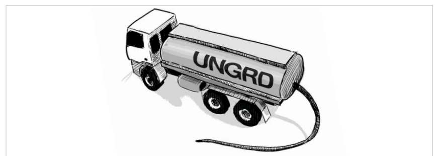
Imagen / Caricatura Bacteria

Han desfilado para la cárcel dos ministros y varios altos funcionarios del Gobierno, se encuentran fugitivos otros más en clara burla a la sociedad colombiana y hacen fila una decena más de congresistas investigados.